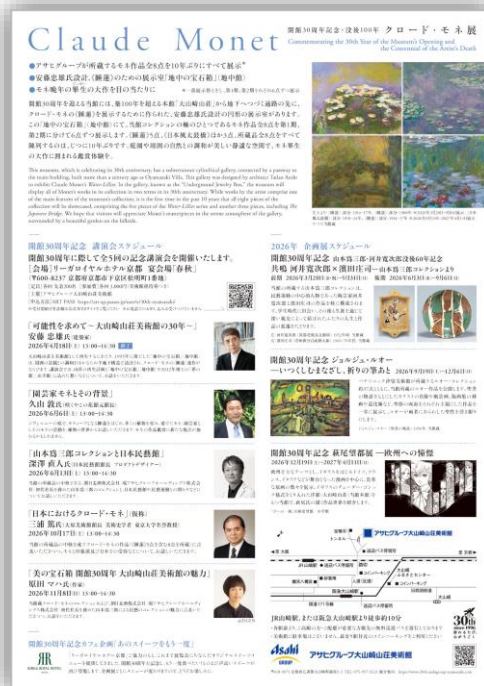
A4チラシ表裏ビジュアル